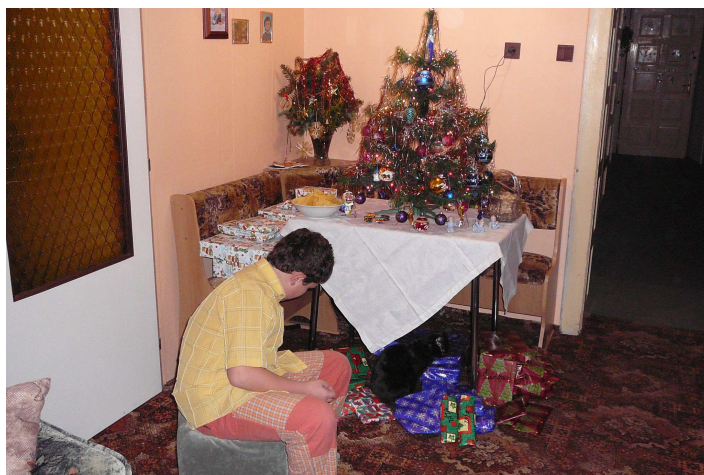
doma u stromečku